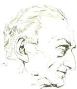
Les Amis de Milosz

(Extraits de Milosz, le chant du feu nocturne, émission proposée par Jean Pietri sur France Culture le 6 mars 2002, à l'occasion de la célébration du 125 e anniversaire de la naissance du poète).